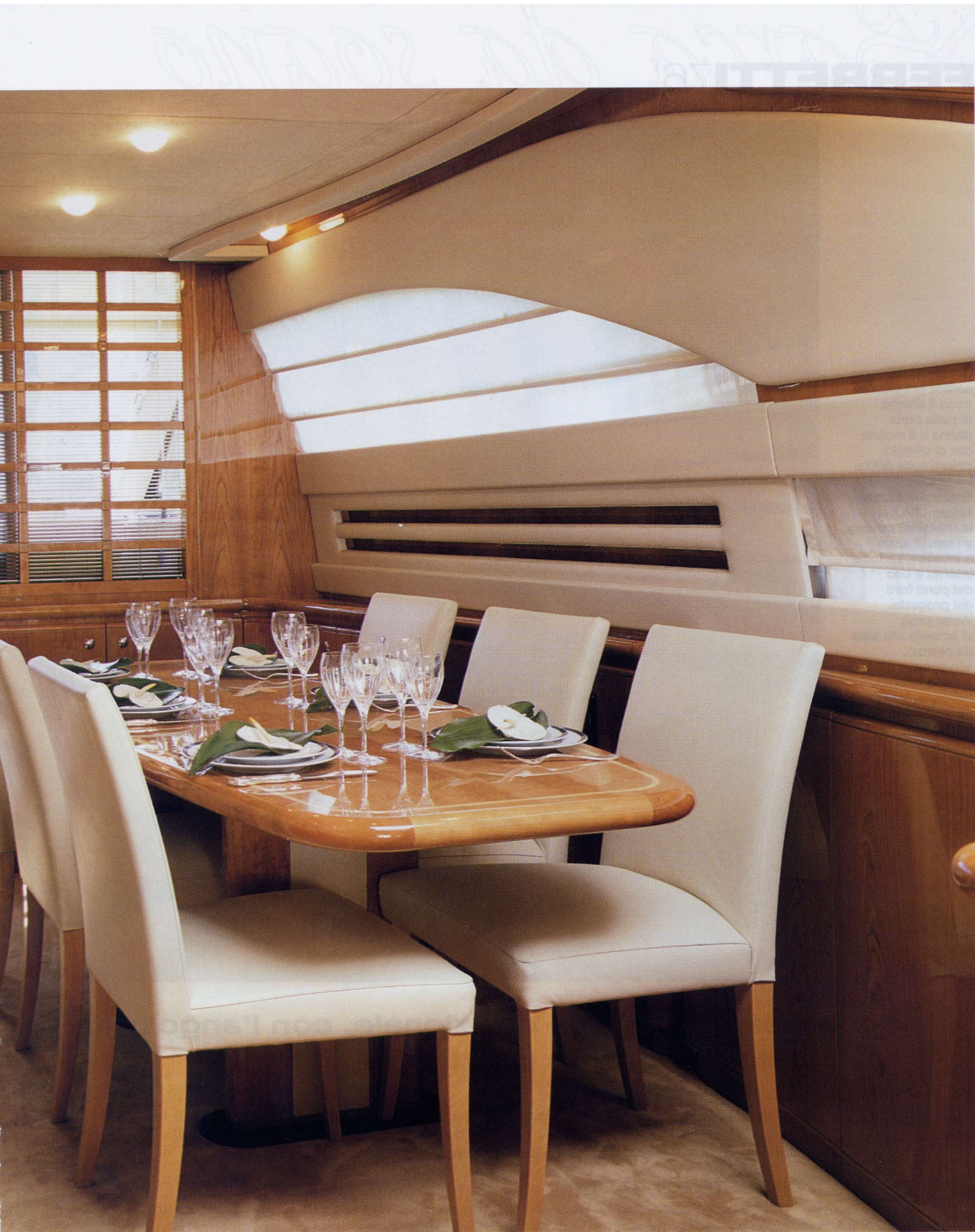
Il piano cottura e lavastoviglie per organizzare un pranzo all'aperto, posto guida dotato di cruscotto